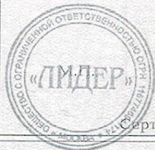
Схема сертификации: 3с.