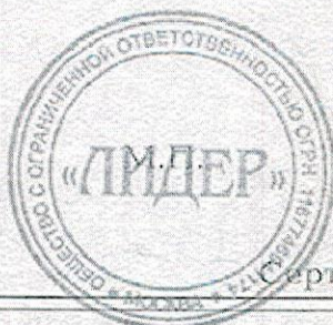
Схема сертификации: 3с.